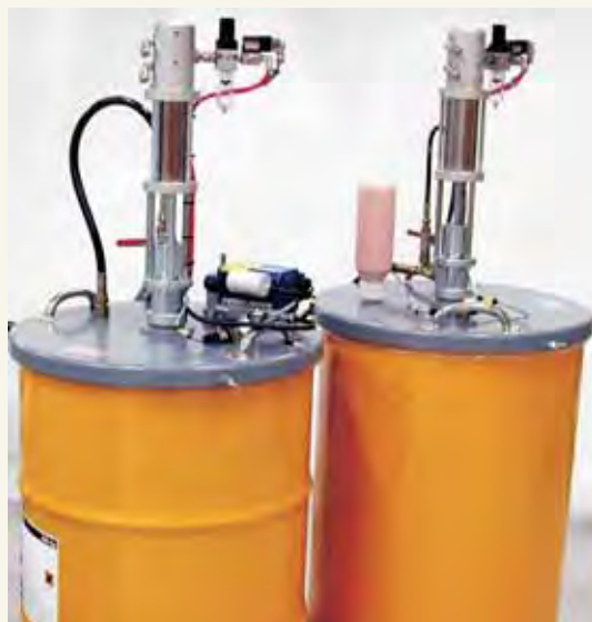
TRP pumar monterade på fatlock med omrörare och silicagefilter.