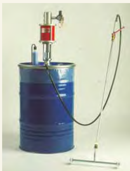
TRP pump utrustad med hjulförsedd limspridare.